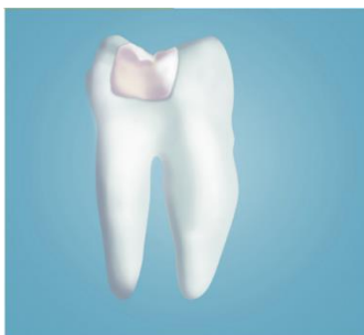
Bild eines Zahnes mit einer Füllung aus Kunst-Stoff.

Reden Sie mit ihrer Zahnärztin oder Ihrem Zahnarzt darüber.